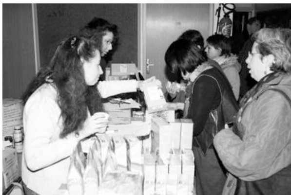
Vente des produits du commerce équitable lors de la semaine de la solidarité internationale de 2004.

Avec la projection du film de François Truffaut « Les quatre cents coups »